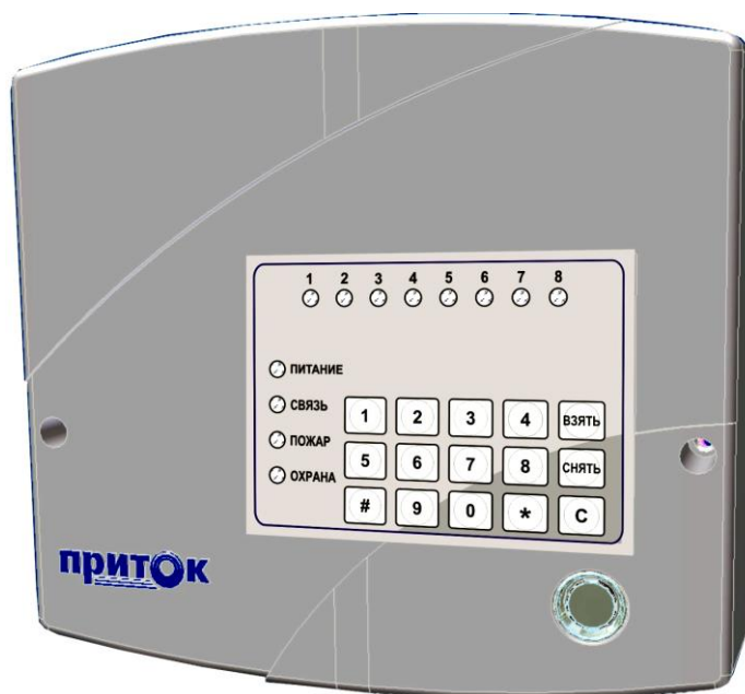
Рисунок 1. Внешний вид прибора

Питание прибора - от сети переменного тока напряжением от 187 до 242 В.