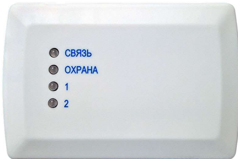
Рисунок 1 - Внешний вид

На передней панели ТК имеются следующие органы индикации: индикаторы « СВЯЗЬ », « ОХРАНА » и два светодиодных индикатора « 1 » и « 2 », отображающих состояние ШС;