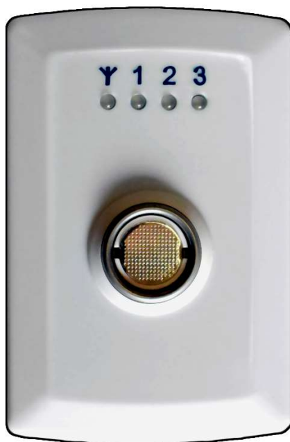
Рисунок 1 – Внешний вид прибора

К прибору через интерфейс Touch Memory (далее по тексту – ТМ ) могут быть подключены устройства, не входящие в комплект поставки: