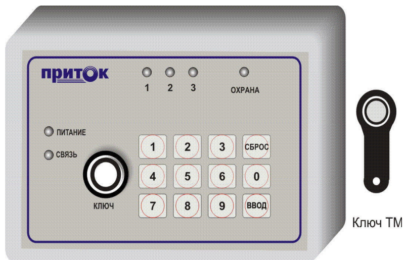
Рисунок 2. Вид передней панели прибора.