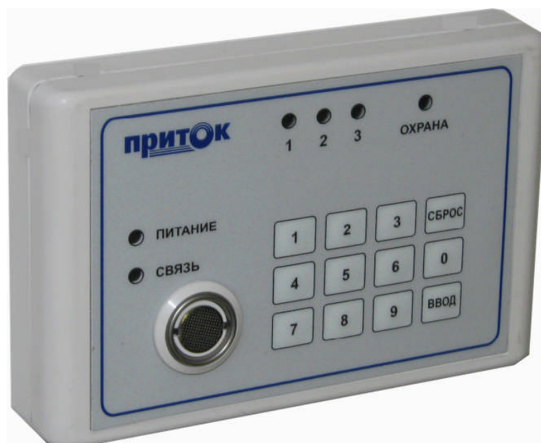
Прибор приемно-контрольный охранно-пожарный ППКОП 011-8-1-05к Приток-А-4(8) ЛИПГ.425212.001-05к РЭ Руководство по эксплуатации