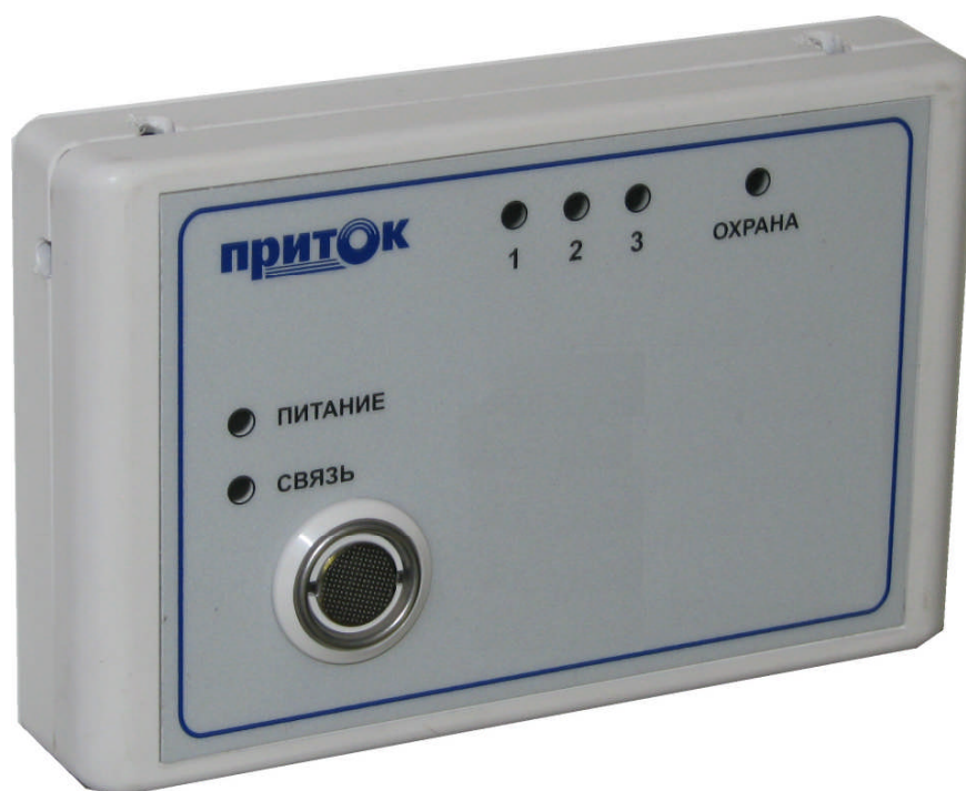
Прибор приемно-контрольный охранно-пожарный ППКОП 011-8-1-05 Приток-А-4(8) ЛИПГ.425212.001-05.01 РЭ Руководство по эксплуатации