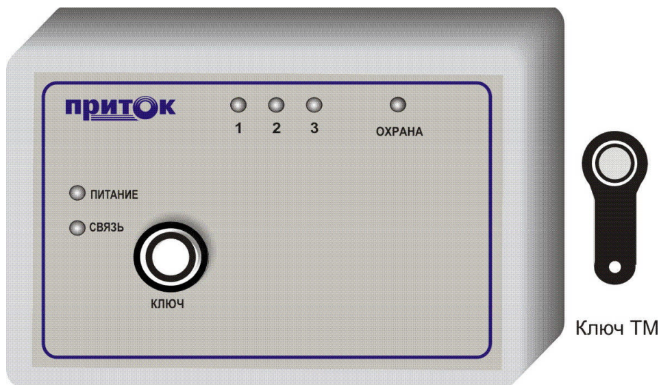
Рисунок 2. Вид передней панели прибора.